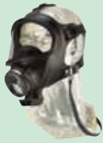
3S mit Transponder 10013877

Polycarbonat (PC) Sichtscheibe. Spezielles Design der Nomex Bänderung zum schnellen und einfachen Auf- und Absetzen.