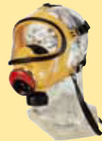
3S-Vg-PF Silikon D2055784