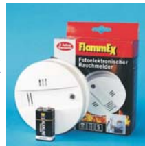
FL 100 22H

Einfache Installation des Gerätes an der Decke