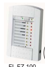
FL FZ 100